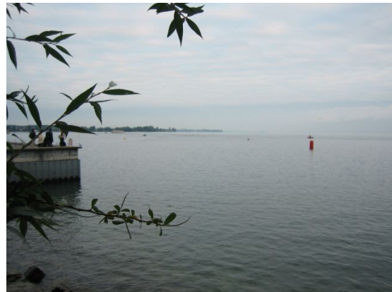
Der glorreiche See