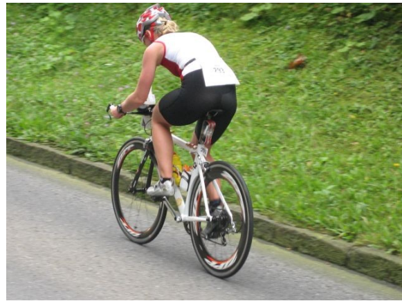
...nur um gleich wieder ordentlich steil zu werden.

Die letzten Kilometer auf dem Rad dachte ich nur noch mit Schrecken an den Marathon. Was sollte das werden, meine Beine waren so zu?!