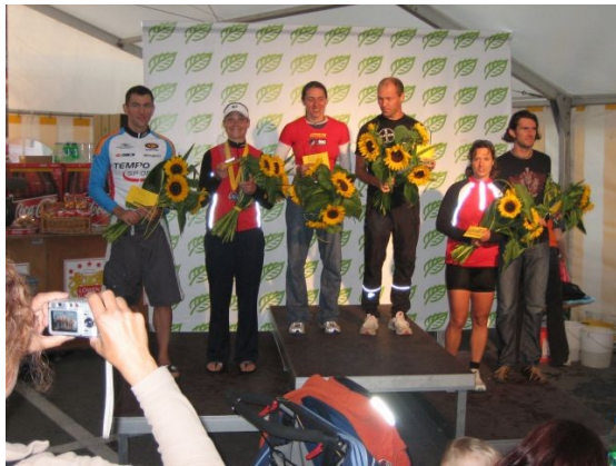
Die glorreichen Sechs