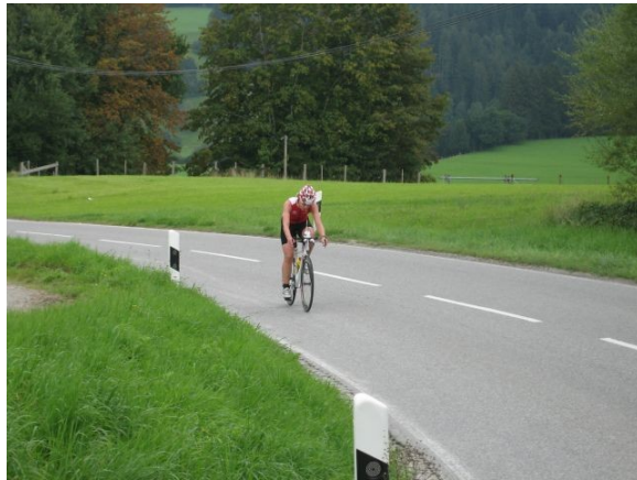
Zur Abwechslung geht's mal weniger Steil bergauf...

Und auch der Rest der Runde war nicht so wirklich meins: Keine leichten gleichmäßigen Anstiege mit Gegenwind wo man schön drücken kann, sondern nur richtig hoch oder richtig runter. Und man kann beim Bergabfahren genauso viel Zeit verlieren, wie man beim Hochfahren gewinnen kann. So wurde der Abstand zur zweiten von Runde zur Runde größer und Betrug zum Ende gute fünf Minuten. Noch kurz zu ‚meiner‘ Ampel: Beim zweiten Mal stand ich natürlich auch wieder und habe die volle Phase mitgenommen, aber diesmal hat es mich nicht im Geringsten gestört, da ich ziemlich kaputt war und so schön durchschnaufen konnte ☺