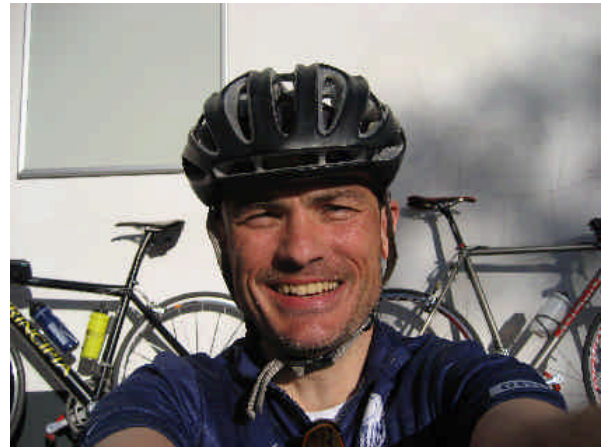
...und so, wenn man ihm Zucker gegeben hat!