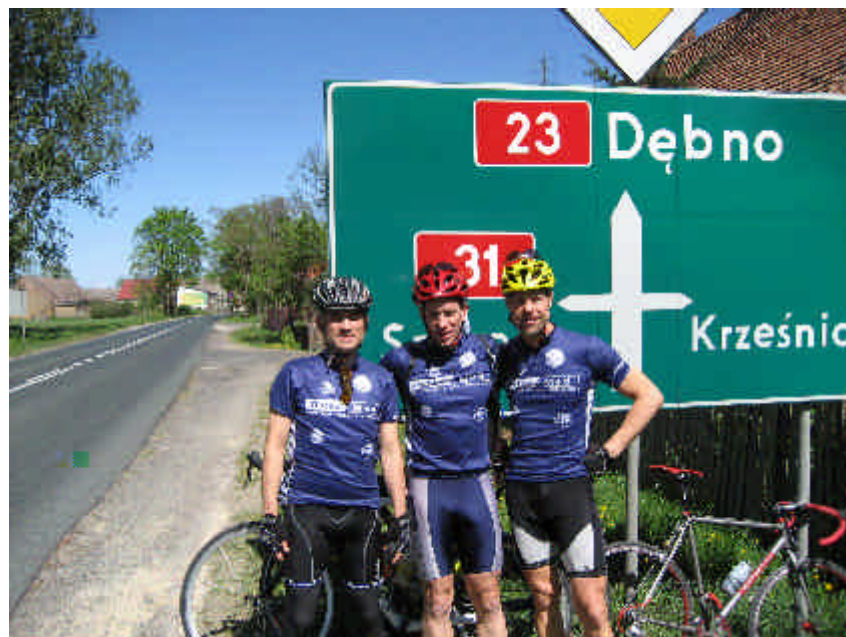
Das ruhmreiche Osteomed-Team