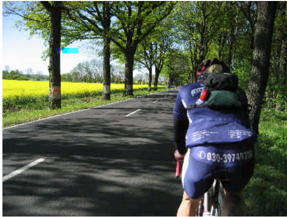
So sieht ein Radfahrer von hinten aus...