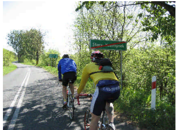
So einsam und friedlich ist es in Polen