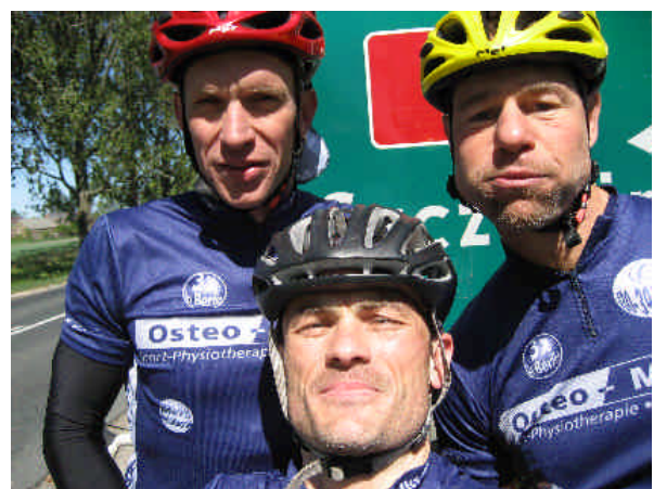
...und so die Deutschen.