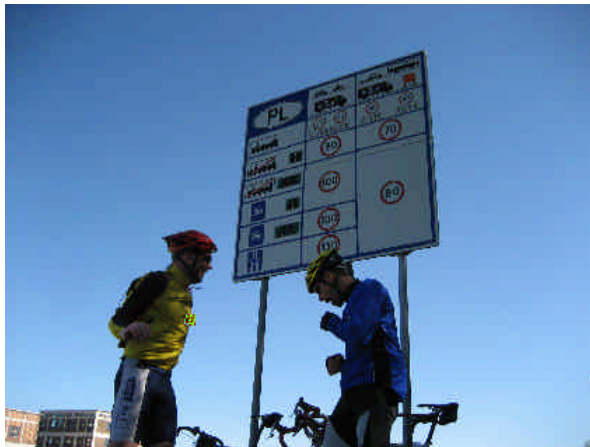
Ab hier ist Polen offen

Klamotten: einer mit Knielingen, zwei leider ohne