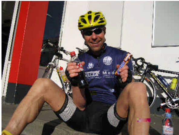
...so wenn er unterzuckert ist...