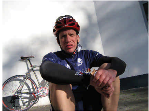
...so von vorne ...