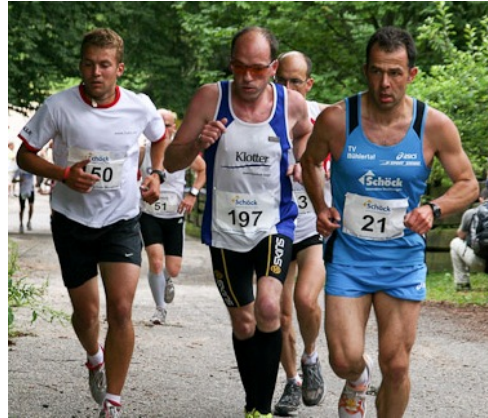
Anfang Runde 2