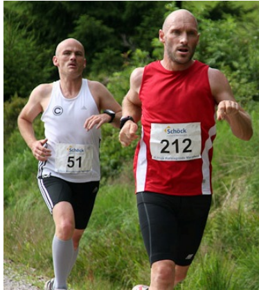
Ende Runde 1