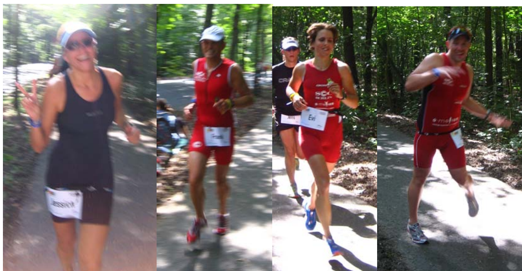
Jessi, heute nicht die Allerschärfste