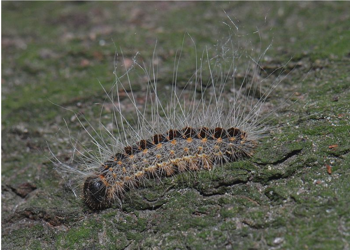
Sportsfreund Eichenspinner wirft seine Haare auch noch ab

Berlin, 22. August 2010, 4:30 Uhr: Überall in Berlin klingeln Wecker. Durchtrainierte Körper springen ausgeschlafen unter eiskalte Duschen. Shampoo, Zahnpasta, ab mit den Körperhaaren - und dann nüsch wie raus nach Wannsee.